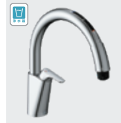
B6 (浄水器ビルトイン形) JF-NAB466SYX(JW) ¥137,000