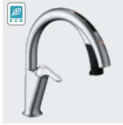
H7 (エコセンサー付) SF-NAH471SY SF-NAH471SYN ¥145,000