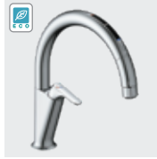
A7 (エコセンサー付) SF-NAA471SY ¥124,000 SF-NAA471SYN ¥127,000