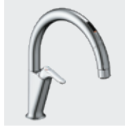
A5 SF-NAA451SY ¥103,000 SF-NAA451SYN ¥106,000