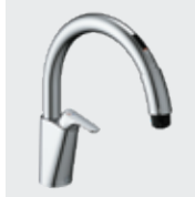
B5 SF-NAB451SYX ¥87,000 SF-NAB451SYXN ¥90,000