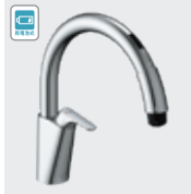
乾電池式B5 SF-NAB454SYX SF-NAB454SYXN ¥97,000