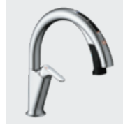
H6 (浄水器ビルトイン形) JF-NAH461SY(JW) JF-NAH461SYN(JW) ¥168,000