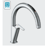
A6 (浄水器ビルトイン形) JF-NAA466SY(JW) ¥153,000